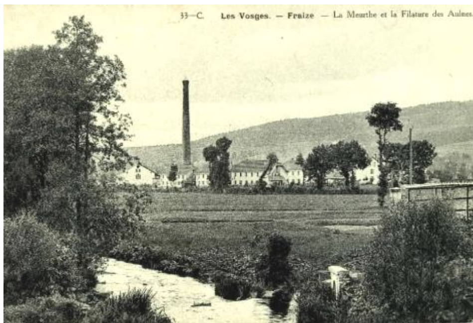
4 Fi 181/34