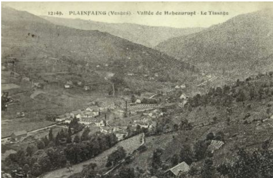
© Archives départementales des Vosges, 4 Fi 349/17